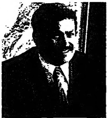
القائم مقام ببيع ابو مراد

عن صوت فلان أو فلان، من أعضاء المجلس البلدي، فوسا على مركزه، وغالبا ما يسخر البلدية وامكاناتها لرضاه.